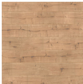
New england oak