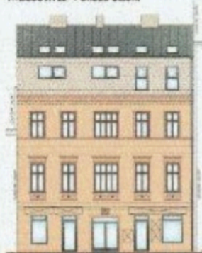
HYBEŠOVA 22 - POHLED ULIČNÍ

Celková energeticky vztažná plocha: 1732,96 m 2