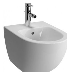
ZÁVĚSNÝ BIDET BIDET VITRA