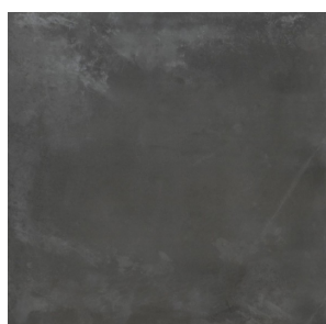
OBKLAD A DLAŽBA LA CERAMICA ICON BLACK