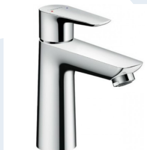
UMYVADLOVÁ BATERIE HANSGROHE TALIS