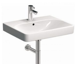
UMYVADLO KOŁO TRAFFIC