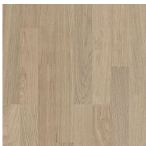
DŘEVĚNÁ PLOVOUCÍ PODLAHA KÄRHS LINEA DUB TIDE