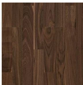
DŘEVĚNÁ PLOVOUCÍ PODLAHA KÄRHS LINEA OŘECH BLOOM