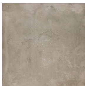
OBKLAD A DLAŽBA LA CERAMICA ICON BROWN