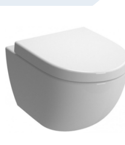
ZÁVĚSNÉ WC VITRA SENTO