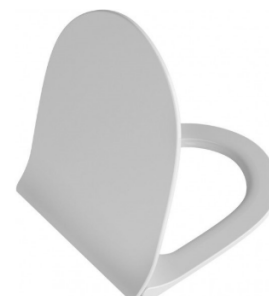
WC SEDÁTKO SOFT CLOSE VITRA SENTO