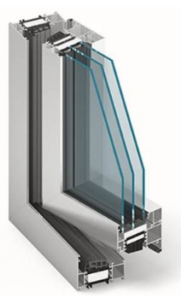
HLINÍKOVÉ OKNO S TROJSKLEM MB 70 TŘÍKOMOROVÉ