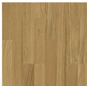
DŘEVĚNÁ PLOVOUCÍ PODLAHA KÄRHS LINEA DUB BREEZE