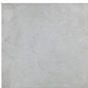
OBKLAD A DLAŽBA LA CERAMICA ICON SILVER