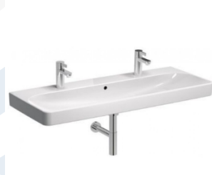
UMYVADLO KOŁO TRAFFIC 120