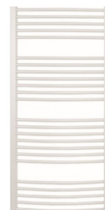
TOPNÝ ŽEBŘÍK CONCEPT 100