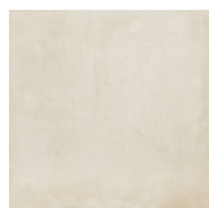
OBKLAD A DLAŽBA LA CERAMICA ICON BEIGE