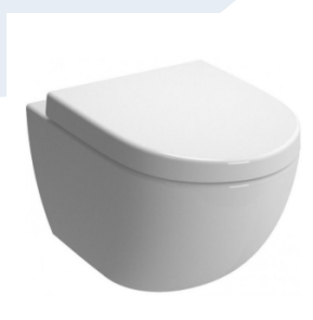
ZÁVĚSNÉ WC VITRA SENTO