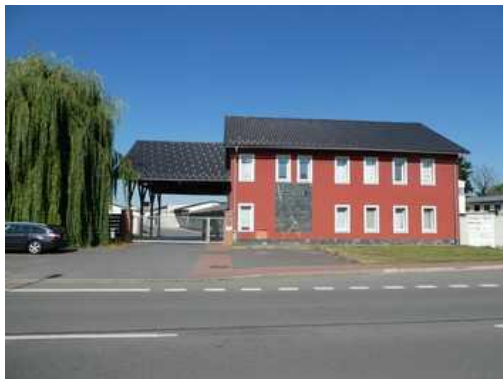
Administrativní budova na p.č. st. 1271