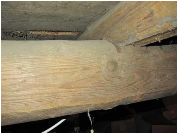
krov - detail (stopy po dřevokazných škůdcích)