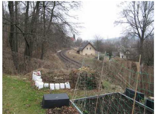
žel. trať přiléhající k zahradě