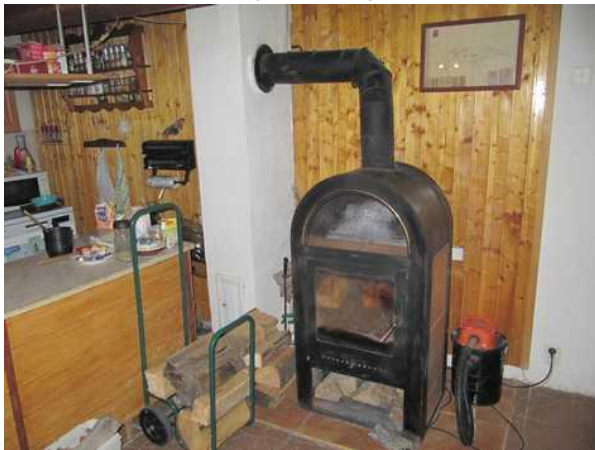
krbová kamna v obývacím pokoji