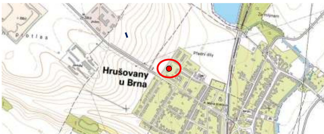
Obr. 1 - Obec Hrušovany u Brna, orientační umístění objektu v obci

Objekt se nachází v obci Hrušovany u Brna, okres Brno-venkov. GPS souřadnice objektu: 49°2'23.937"N, 16°35'5.574"E