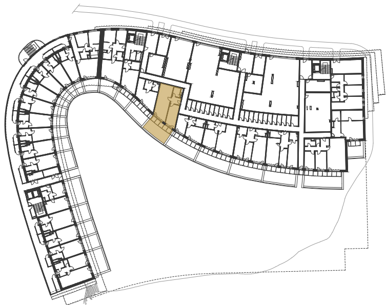
SCHEMA UMÍSTĚNÍ JEDNOTKY NA PODLAŽÍ / M 1:1000