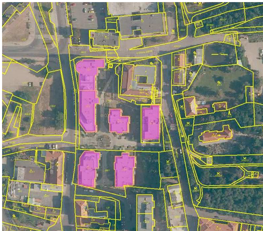
Obrázek 1: Situace stavby.

Výsledkem posouzení je zpracování protokolu k průkazu energetické náročnosti budovy a grafické vyjádření. Posouzení vychází z požadavků vyhlášky č. 148/2007 Sb. o energetické náročnosti budov.