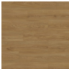
Wheat cornforth oak