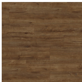
Fawn apollo oak