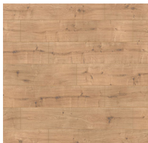
New england oak